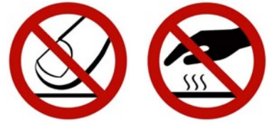
Rys. 2. Przykładowe znaki bezpieczeństwa – znaki zakazu: „Zakaz dotykania”, „Powierzchnia gorąca”