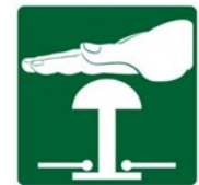
Rys. 5. Przykładowe znaki bezpieczeństwa – znaki informacyjne: „Wyłącznik awaryjny”