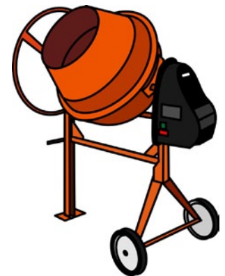
Rys. 6. Osłona elementów napędowych