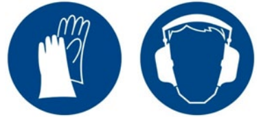
Rys. 4. Przykładowe znaki bezpieczeństwa – znaki nakazu: „Nakaz stosowania środków ochrony”